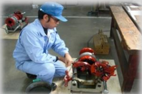
鋼管のねじ切りと継手の接続体験