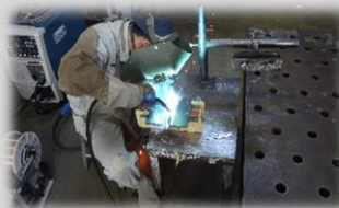
鋼板の溶接体験 (指導員介添え)