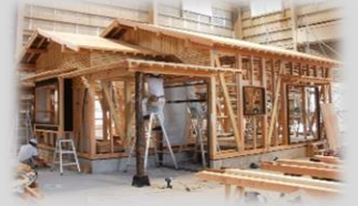
かなな・金づちなどの工具体験