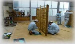
植栽、竹垣作成体験