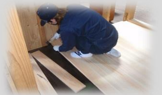
床のリフォーム体験