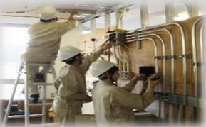
結線、点灯などの電気配線作業体験