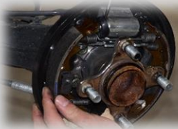
ブレーキ装置の点検体験