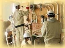
結線、点灯などの 電気配線作業体験