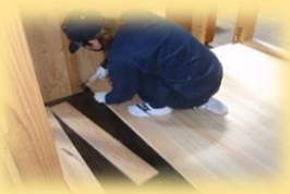
床のリフォーム体験