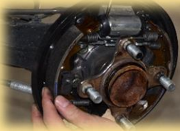
ブレーキ装置の点検体験