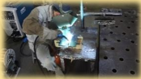
鋼板の溶接体験 (指導員介添え)