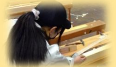
かんな・金づちなどの工具体験