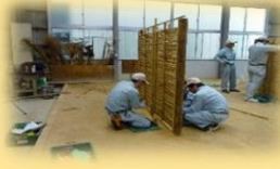
植栽、竹垣作成体験