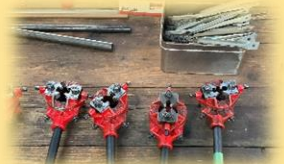
鋼管のねじ切りと 継手の接続体験